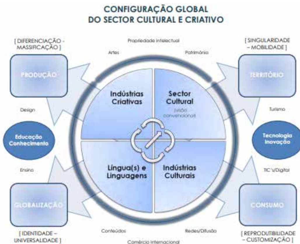
Figura 1: Configuração do SCC

A delimitação proposta para o setor abarca quatro constituintes (Figura 1). As atividades relacionadas com o património e as artes são consideradas o núcleo, aglomerando as indústrias culturais e as criativas e as línguas/linguagens em que se exprimem. Há dinâmicas que se estabelecem entre as realidades do território e da globalização e da produção e do consumo, que, se nem sempre pacíficas, estão na origem dos equilíbrios entre realidades díspares como a diferenciação e a massificação, a singularidade e a mobilidade, a identidade e a universalidade ou a reprodutibilidade e a customização. Entre as atividades que acentuam a procura e valorizam os bens e os serviços culturais são destacadas, entre outras, a educação/formação, o turismo, a tecnologia e a digitalização, umas agindo a montante da cadeia de valor e outras a jusante, mas todas elas estimulando a produção, distribuição e consumo dos produtos criativos.