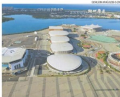
Instalações. Velódromo e as Arenas Cariocas 1 e 2; responsabilidade da Aglo

Em agosto do ano passado, o gasto era estimado em R$ 7,09 bilhões com instalações esportivas. O custo total da Olimpíada do Rio chegou a R$ 41,03 bilhões, já que envolve também o plano de legado de políticas públicas, orçado em R$ 24,6 bilhões, e o orçamento do Comitê Rio-2016, na casa de R$ 9,2 bilhões. O número, no entanto, ainda pode crescer devido às dívidas do comitê, que totalizam R$ 132 milhões. Por en-